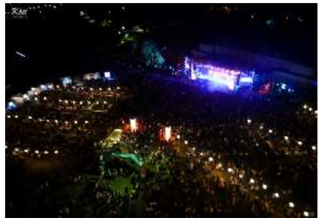
Foto nga Festa e Birrës 2015