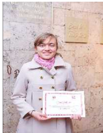
Foto nga Ceremonia e shpërndarjes së çertifikatave për gjimnazistët e shkëlqyer