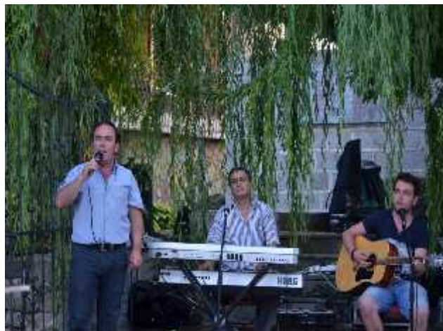
Foto nga aktiviteti festa e lakrorit