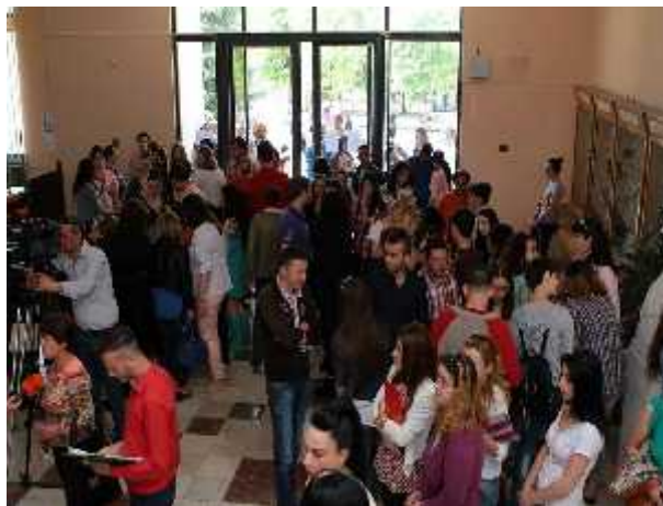
Foto nga Panairi i Punës 2015